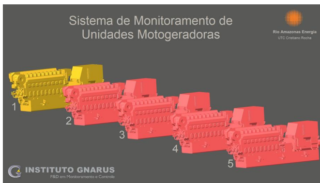
Sala de controle com o computador dedicado ao sistema e sua tela inicial